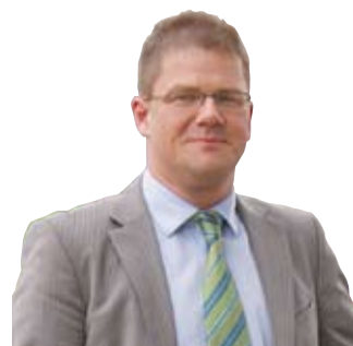
Holger Apfel, Fraktionsvorsitzender