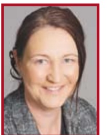
Gitta Schüller, MdB

In Sonntagsreden wurden Kritiker abqualifiziert und Freudenfeste an Grenzübergängen veranstaltet. Man verwies auf einen angeblichen Rückgang oder eine „gefühlte“ Grenzkriminalität. Die Tatsachen sprechen eine andere Sprache. Sicherheitskonferenzen und hohle Sprüche überforderter Politiker liefern ganz gewiß nicht die Antwort auf die Fragen der Zeit. Man kann keinem der Betroffenen, Bürger oder Bauern, verübeln, wenn in diesen schweren Zeiten über Mittel der Selbsthilfe nachgedacht oder vielleicht auch dementsprechend gehandelt wird. Die Landwirte werden im wahrsten Sinne des Wortes zu Bauernopfern.“