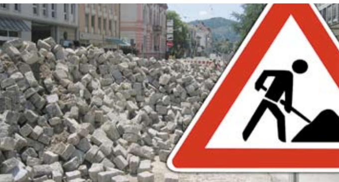
Baustelle Arbeitsmarkt: Leiharbeit ist keine Lösung. Die NPD-Fraktion fordert vollwertige Arbeitsplätze für alle Sachsen!

Unser Ziel ist es, die Menschen in Sachsen wieder in ordentliche Beschäftigungsverhältnisse zu bringen. Lohndrückerei durch Zeitarbeit ist nicht die Lösung unserer Probleme, sie ist selbst das Problem.